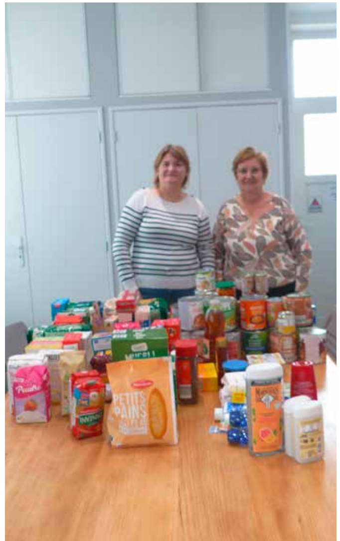
« 62,5 kg de denrées alimentaires collectées »

Les inscriptions ont eu lieu cette année le mardi 28 octobre 2025 à la salle des fêtes de Marcoing de 9h à 12h et de 14h à 16h30, la distribution se fera sur Marcoing comme chaque année.